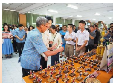
ศิลปะมวยไทยจากวัสดุท้องถิ่น