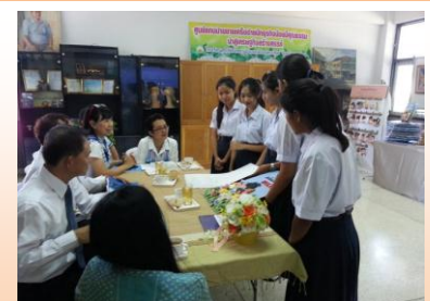
ผลงาน “กรุงเทพฯ ยุวฉนิช