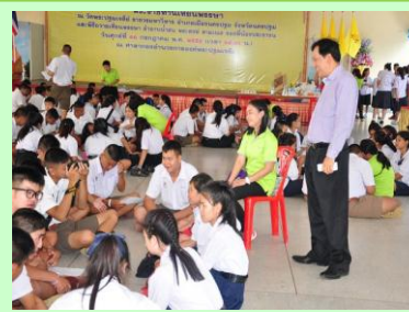
สร้างขวัญและกำลังใจนักเรียน