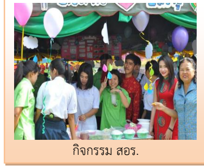
กิจกรรม สอ.