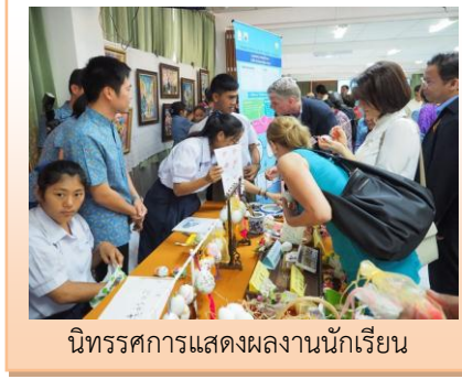
นิทรรศการแสดงผลงานนักเรียน

โรงเรียนส่งเสริมให้ผู้เรียนมีทักษะในการทำงาน รักการทำงาน สามารถทำงานร่วมกับผู้อื่นได้และมีเจตคติที่ดีต่ออาชีพที่สุจริต ครูจัดการเรียนรู้ที่เน้นผู้เรียนเป็นสำคัญ และบูรณาการหลักปรัชญาของเศรษฐกิจพอเพียงตามที่กำหนดไว้ในหลักสูตรของทุกกลุ่มสาระฯ ส่งเสริมให้มีการสอนโดยใช้โครงงานเป็นฐาน ผู้เรียนได้เรียนรู้ ศึกษา ค้นคว้า วิเคราะห์ รวบรวมข้อมูล และนำเสนอข้อมูลได้ นอกจากนี้โรงเรียนจัดกิจกรรมส่งเสริมการประกอบอาชีพอิสระเพื่อการหารายได้ระหว่างเรียน (สอ.) ในทุกกลุ่มสาระฯ