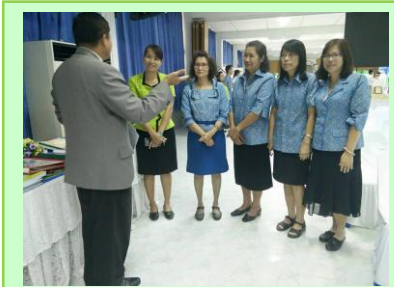
ร่วมประเมินคุณภาพภายใน