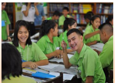
เรียนรู้วัฒนธรรมและภาษาจีน