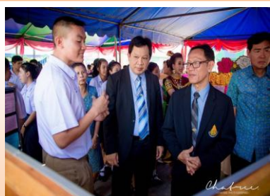
การนำเสนอผลงานรายวิชา IS