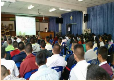
สอนเสริมนักเรียน ๕ กลุ่มสาระฯ