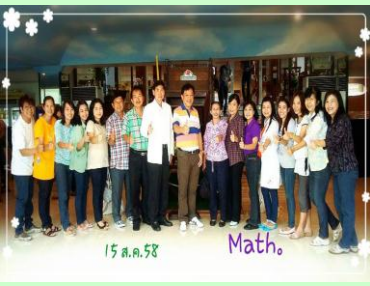
ศึกษาดูงานโรงเรียนราชสีมาวิทยาลัย