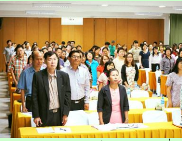
ถวายสัตย์ปฏิญาณเป็นข้าราชการที่ดี