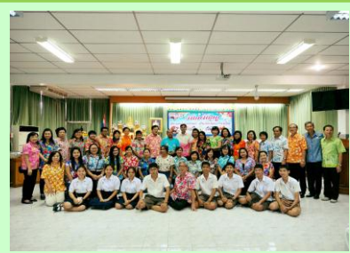
งานกตัญญู