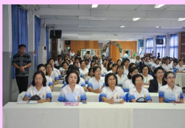
หน่วยงานภายนอกเยี่ยมชมผลงาน