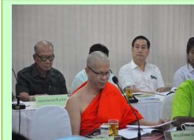
ประชุมคณะกรรมการสถานศึกษา

โรงเรียนควรให้คณะกรรมการสถานศึกษาขั้นพื้นฐาน ชุมชน และผู้ปกครอง ได้มีส่วนร่วมในการประเมินผลการปฏิบัติงานของผู้บริหาร คณะครู และบุคลากร ให้ปฏิบัติงานตามบทบาทหน้าที่อย่างมีประสิทธิภาพและเกิดประสิทธิผลอย่างต่อเนื่อง ทุก ๖ เดือน