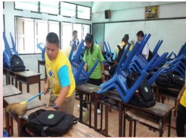
กิจกรรมบำเพ็ญประโยชน์