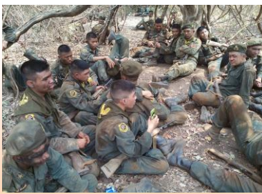
ค่ายนักศึกษาวิชาทหาร