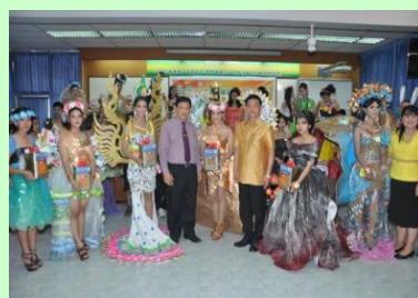
ประกวดมิสรีไซเคิล