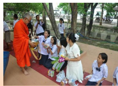
กิจกรรมทำบุญตักบาตร