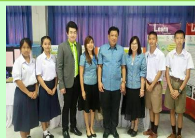
การประเมินคุณภาพภายในจาก สพม.9