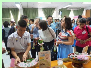
เสนอผลงานเศรษฐกิจพอเพียง