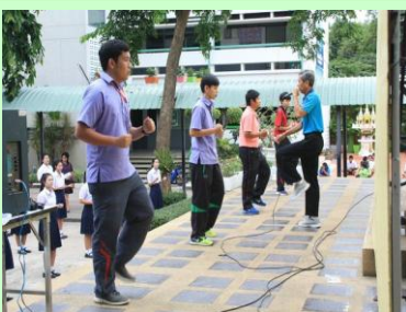
เสริมสร้างสุขภาพที่ดีทั้งกายและใจ