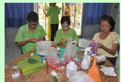
ประดิษฐ์กระทง