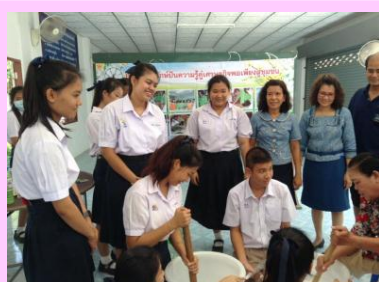
บรรณารักษ์อาสาสู่ชุมชน