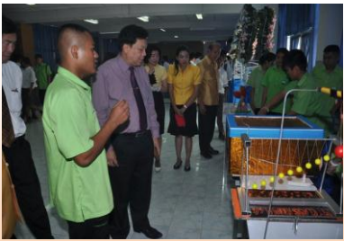
การนำเสนอผลงานทางวิทยาศาสตร์