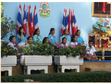
กิจกรรมวันแม่แห่งชาติ