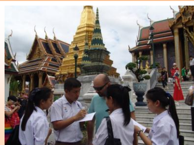
สัมภาษณ์นักท่องเที่ยวน วัดพระแก้ว