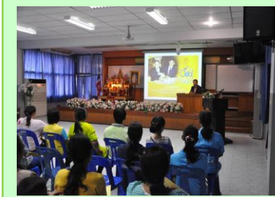
ประชุมผู้ปกครองนักเรียน