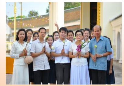
เวียนเทียนวันสำคัญทางศาสนา