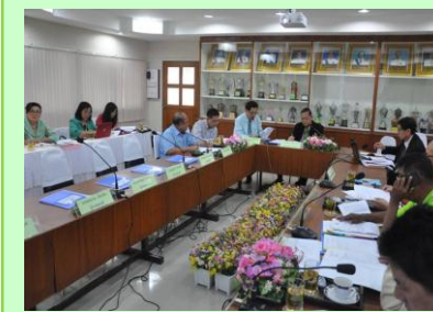
ประชุมคณะกรรมการสถานศึกษา