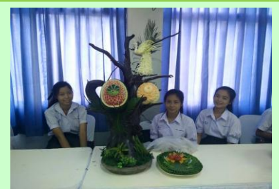
การประเมินคุณภาพภายในจาก สพม.9