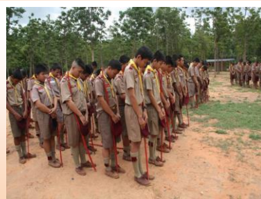
กิจกรรมเข้าค่ายลูกเสือ