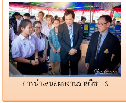
การนำเสนอผลงานรายวิชา IS

โรงเรียนควรกำหนดโครงการ/กิจกรรมเพื่อพัฒนาผู้เรียนมีทักษะในการทำงาน รักการทำงาน สามารถทำงานร่วมกับผู้อื่นได้และมีเจตคติที่ดีต่ออาชีพสุจริตให้ทั่วถึงทุกกลุ่มสาระการเรียนรู้ รวมทั้งให้ประเมินผลทักษะในการทำงาน รักการทำงาน สามารถทำงานร่วมกับผู้อื่นได้และมีเจตคติที่ดีต่ออาชีพสุจริต ในภาพรวมเป็นร้อยละของโรงเรียน