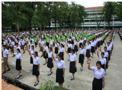
กิจกรรม กายบริหาร แอโรบิค