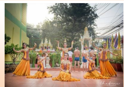
การแสดงนาฏศิลป์