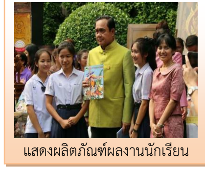
แสดงผลลักษณ์ผลงานนักเรียน