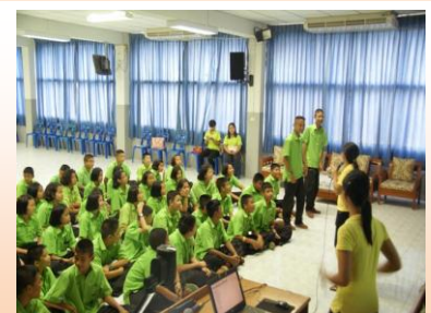
กิจกรรมงานห้องเรียนพิเศษ EIS