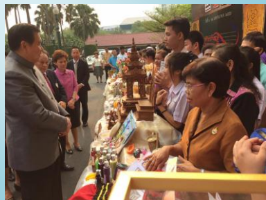
นำเสนอผลงาน ณ ตลาดคลองผดุงฯ