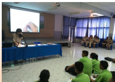
สอนเสริมนักเรียน ๕ กลุ่มสาระฯ