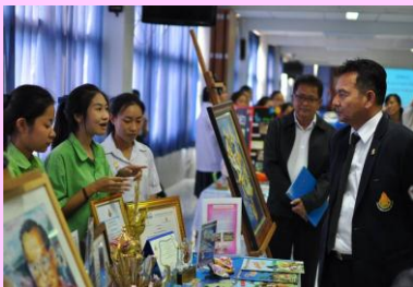
หน่วยงานภายนอกเยี่ยมชมผลงาน