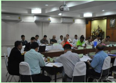
ประชุมคณะกรรมการสถานศึกษา