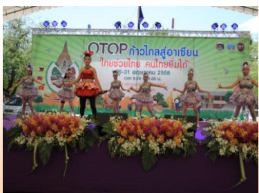
ร้องเพลงลูกทุ่ง