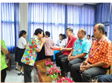
รตนาขอพรผู้ใหญ่ : วันกตัญญู