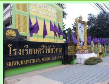
บริเวณหน้าโรงเรียน