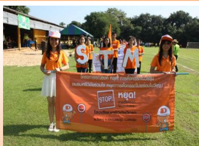
นักเรียนแกนนำ STOP TEEN MOM