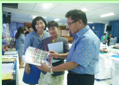
การประเมินคุณภาพภายในจาก สพม.9