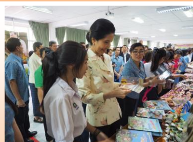
การนำเสนอผลงานนิทานการ์ตูน