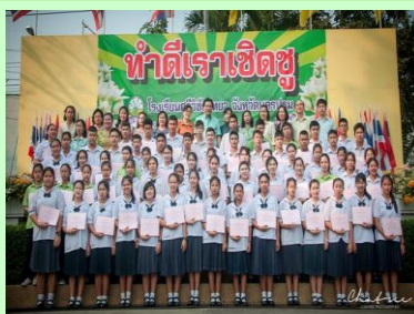
ยกย่องเชิดชูเกียรตินักเรียนทำดี