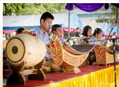
ดนตรีไทย