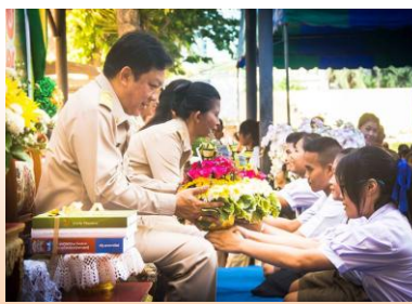
กิจกรรมไหว้ครู