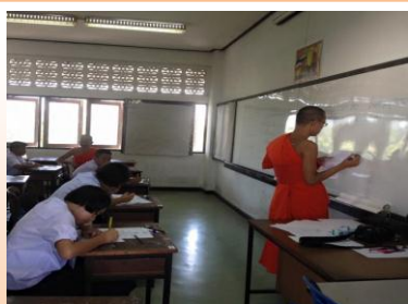
สอบธรรมศึกษา