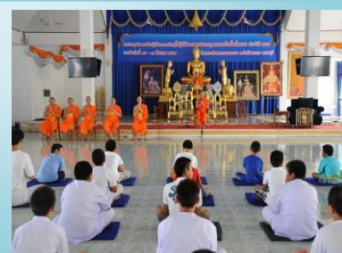
บรรพชาสามเณรภาคฤดูร้อน