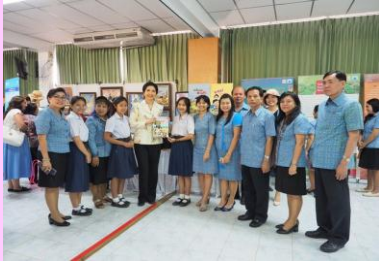
นำเสนองานเศรษฐกิจพอเพียง