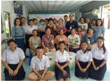
บรรณารักษ์อาสา