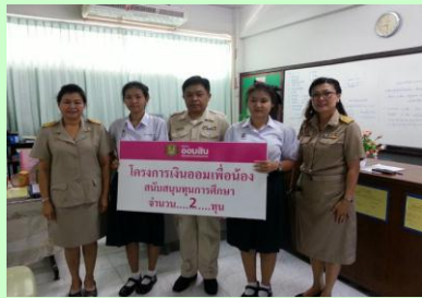
ธนาคารโรงเรียน