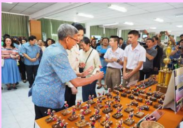
นำเสนองานเศรษฐกิจพอเพียง