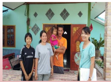
ระบบดูแลช่วยเหลือนักเรียน