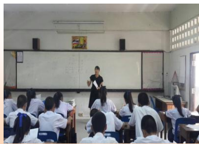
สอนเสริมนักเรียน ๕ กลุ่มสาระฯ