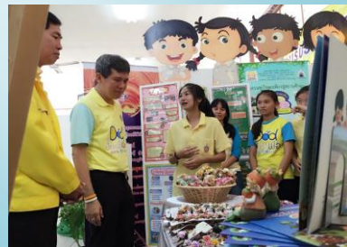
ผลงานนักเรียน