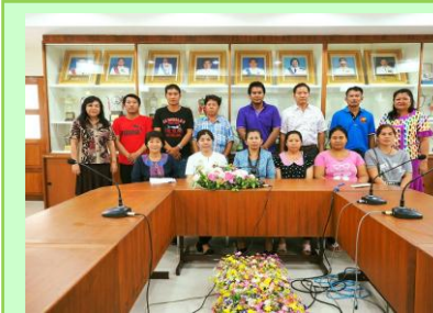
ประชุมผู้ปกครองนักเรียน