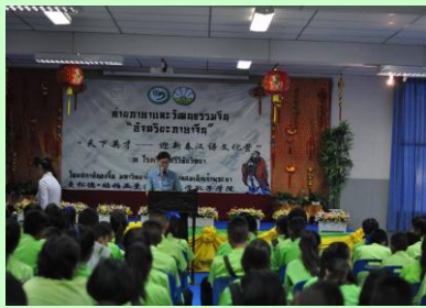
ค่ายภาษาจีน