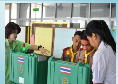
เรียนรู้ประชาธิปไตย : เลือกตั้ง