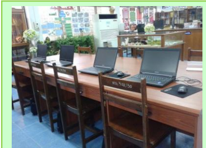
ห้องสมุด