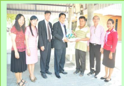
สวัสดีปีใหม่