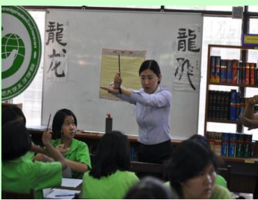
แลกเปลี่ยนเรียนรู้กับ ม.ราชภัฏ