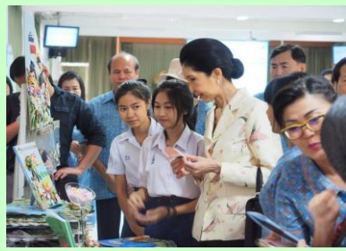
เสนอผลงานเศรษฐกิจพอเพียง