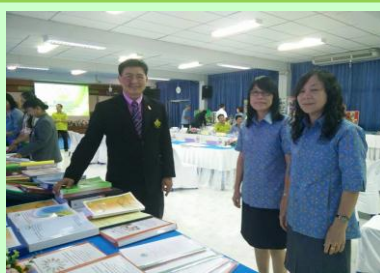
การประเมินคุณภาพภายในจาก สพม.9