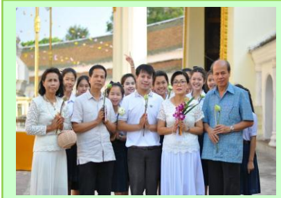
นำนักเรียนร่วมเวียนเทียน