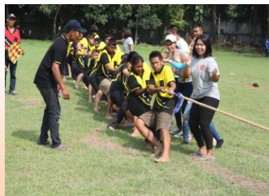
การแข่งขันกีฬาภายใน