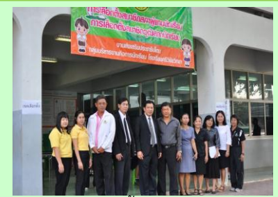
การเลือกตั้งสถานนักเรียน