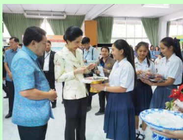
ต้อนรับภริยานายกรัฐมนตรี