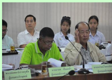
ประชุมคณะกรรมการไตรภาคี 4 ฝ่าย