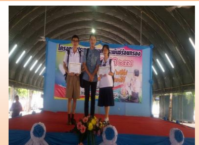
ประกวดแข่งขันงานวันภาษาไทย