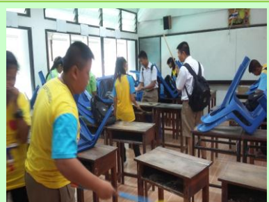
ทำความสะอาดห้องเรียน