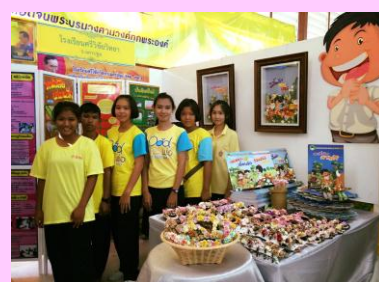
นักรุกจิ๋นน้อย