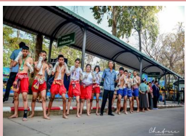
การแสดงมวยไทย