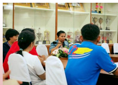
ประชุมผู้ปกครองนักเรียนเครือข่าย