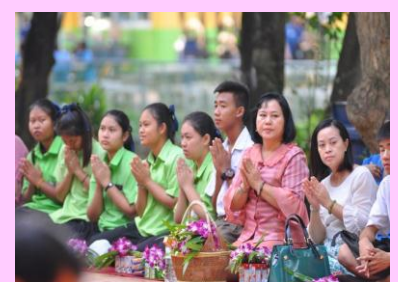
ตักบาตรพระสงฆ์