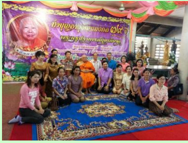
มุขิตาคารวะเจ้าอาวาสวัดฯ