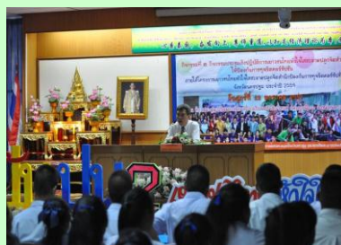
ผู้ว่าราชการ จ.นครปฐม พบนักเรียน