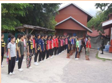
ค่ายลูกเสือ - ยุวกาชาด