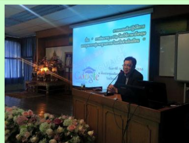
อบรมเชิงปฏิบัติการระบบดูแลนักเรียน