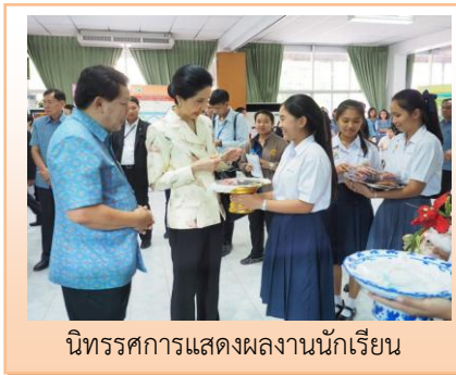
นิทรรศการแสดงผลงานนักเรียน