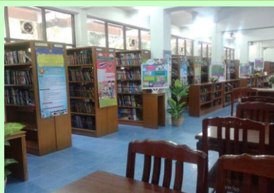
ห้องสมุดโรงเรียน