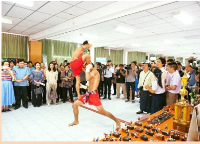
การแสดงศิลปะมวยไทย