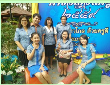
กิจกรรมวันครู