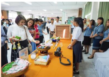
การนำเสนอผลงานทางวิทยาศาสตร์