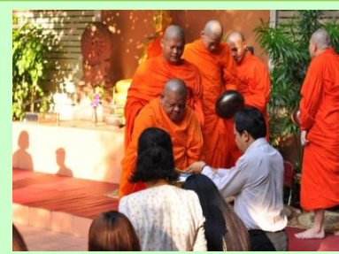
ทำบุญตักบาตรพระสงฆ์