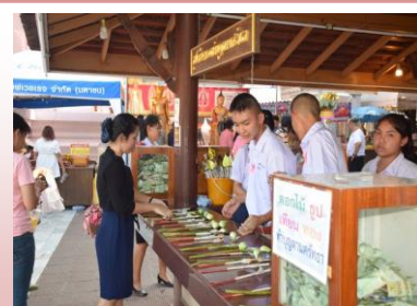
จำหน่ายซूप เทียน ทอง