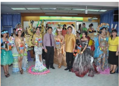
แฟชั่นโชว์จากวัสดุรีไซเคิล