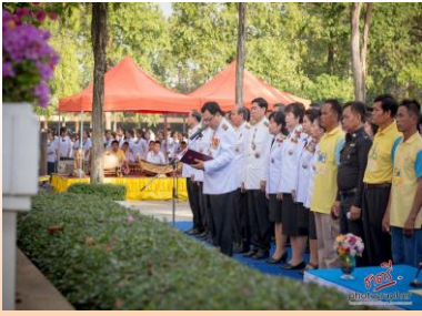
กิจกรรมวันพ่อแห่งชาติ