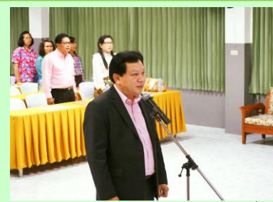
ถวายสัตย์ปฏิญาณเป็นข้าราชการที่ดี