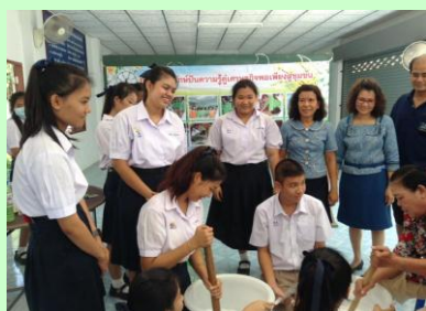
บรรณารักษ์อาสาสู่ชุมชน