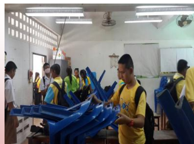
กิจกรรมบำเพ็ญประโยชน์