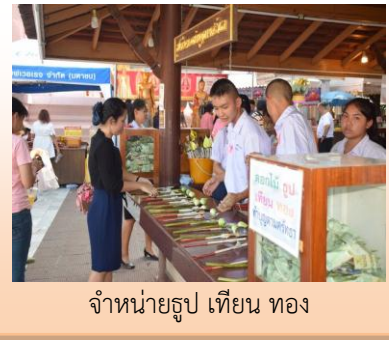
จำหน่ายรูป เทียน ทอง