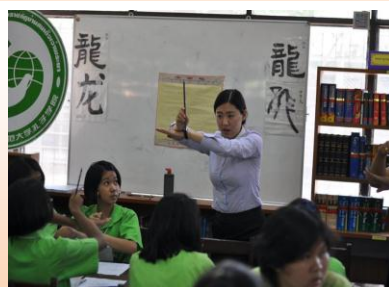
เรียนรู้วัฒนธรรมและภาษาจีน