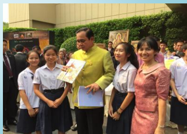
นำเสนอผลงาน ณ ตลาดคลองผดุงฯ