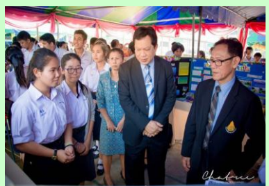
นำเสนอผลงานรายวิชา 15