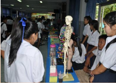
การนำเสนอโครงงานวิทยาศาสตร์