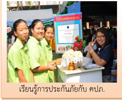
เรียนรู้การประกันภัยกับ คปภ.